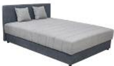
Krevet Ivona 33.990,-