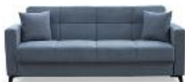
Trosed Planet 27.990,-