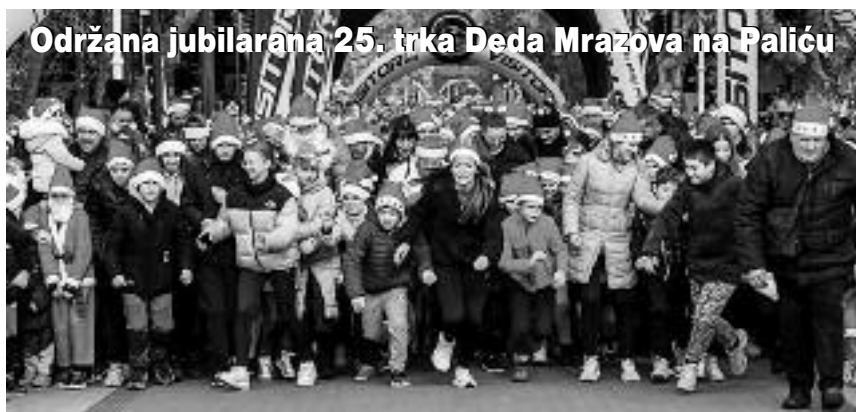
Održana jubilarana 25. trka Deda Mrazova na Paliću

Već četvrt veka Palić je mesto okupljanja Deda Mrazova svih uzrasta, koji zajedno prolaze stazom kroz Park Palić, a na cilju svako biva nagrađen medaljom. Sem zabavnog, trka ima i humanitarni karakter, budući da se svake godine prikupljaju slatkiši za paketiće za decu iz socijalno ugroženih porodica.