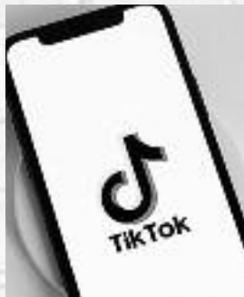
grupi korisnika – deci i tinejdžerima.

Savremene tehnologije, poput veštačke inteligencije (AI) i proširene realnosti (AR), sve češće oblikuju način na koji mladi vide sebe i druge. Iako ovakve inovacije mogu biti zabavne i kreativne, njihova neumerena upotreba može imati ozbiljne posledice na mentalno zdravlje. TikTakov potez je pokušaj balansiranja između kreativnosti i odgovornosti prema najosetljivijoj