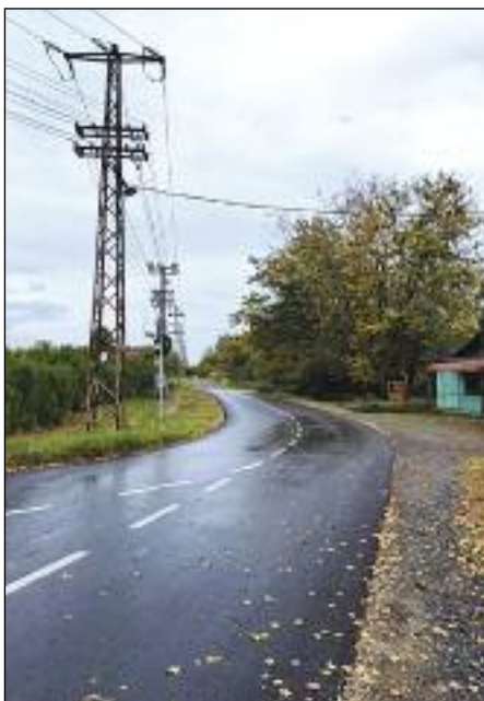
Asfaltirani deo Palmine ulice koji spaja Radnovačku sa Peščarinom ulicom