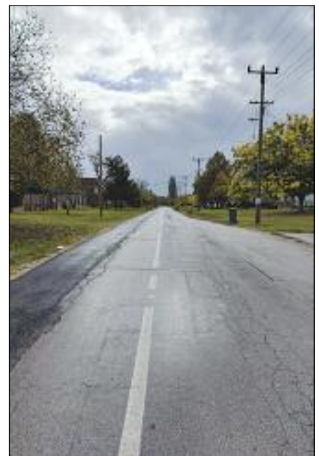
Proširena Peščarina ulica

Ovaj projekat „Mesne zajednice u Subotici (juče, danas, sutra)” je sufinansiran sredstvima iz budžeta Grada.