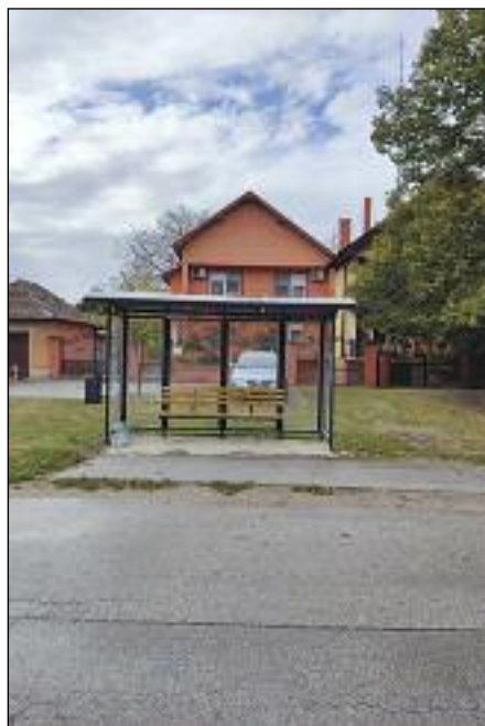
Novo autobusko stajalište