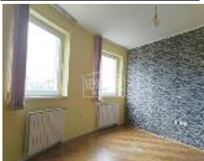
PROZIVKA, prodaje se trosoban stan, duplex, novija zgrada, odlična lokacija, terasa, lift, IV sprat, 80 m 2 / 75.000 evra