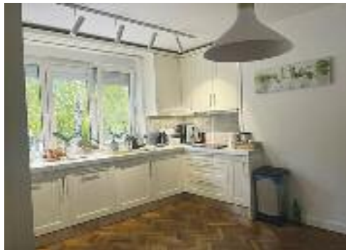
RADIJALAC, stan u prizemlju, dvostrano orijentisan, poseduje dve spavaće sobe, dnevni boravak i trpezariju sa kuhinjom, kompletno renoviran i namešten se prodaje 70 m 2 / 85.000 evra