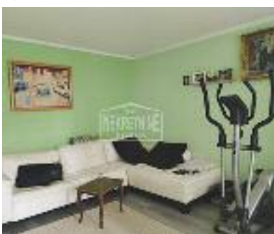
PROZIVKA, dvosoban renoviran stan blizu škole, vrtića, nalazi se na II spratu u zgradi sa liftom, 60 m 2 , 68.000 evra