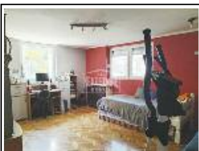
MALI BAJMOK, prodaje se kuća u mirnoj ulici, na lepom placu od 545 m 2 , blizu škole i vrtića, mogućnost kupovine na kredit, kuća nije kompletno završena (potkrovlje), 170 m 2 / 65.000 evra