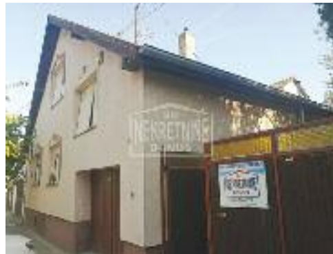
NOVO SELO, prodaje se kuća za višečlanu porodicu nedaleko od centra uz mogućnost kupovine na kredit, 197 m 2 89.500 evra

DUDOVA ŠUMA, prodaje se kuća u blizini Majšanskog mosta, nedaleko od centra, u ulici gas, 123 m 2 52.500 evra