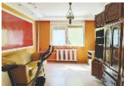
RADIJALAC, prodaje se stan na odličnoj lokaciji, 1 sprat, 3 sobe, zatvorena terasa, 62 m 2 / 62.000 evra