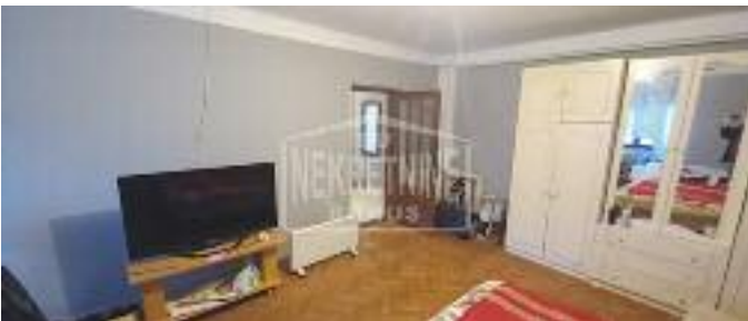
RADIJALAC, prodaje kuća od čvrstog materijala, tri sobe, centralno grejanje na struju, u ulici postoji gas, 120 m 2 / 74.000 evra