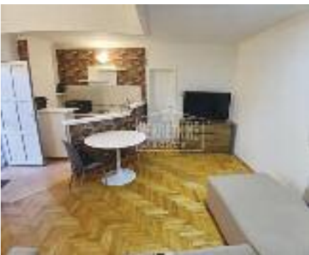
RADIJALAC, prodaje se jednosoban stan u mirnoj ulici, u maloj zgradi, PVC stolarija, grejanje na klimu, 41 m 2 49.700 evra