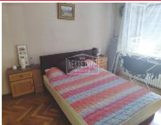
RADIJALAC, prodaje se stan na III spratu na atraktivnoj lokaciji, dve terase, grejanje „Toplana“, podrumaska ostava, 51 m 2 56.000 evra