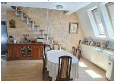
RADIJALAC, trosoban duplex stan na odličnoj lokaciji, u novijoj zgradi, ima zatvoren parking, poseduje dve terase, 75 m 2 / 89.500 evra