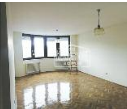
KERTVAROŠ, prodaje se veliki stan na mirnom mestu, velika dnevna soba + dve spavaće sobe, dva kupatila, prvi sprat, gas, 98 m 2 / 99.000 evra