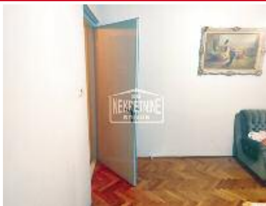
KERTVAROŠ, prodaje se dvosoban stan (dve sobe + dnevni boravak) u prizemlju, podrumaska ostava, garaža, terasa, centralno grejanje, 70 m 2 / 75.000 evra