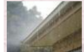
Pregled krovne konstrukcije iznutra

Ovaj deo pregleda uključuje ulazak u tavan ili potkrovlje kako bi se proverilo stanje drvenih elemenata konstrukcije. Potražite znakove vlage, mrlje, plesni ili trule drvene elemente. Detektor vlage može pomoći u otkrivanju vlažnih mesta koja nisu vidljiva golim okom. Pregledajte izolaciju i