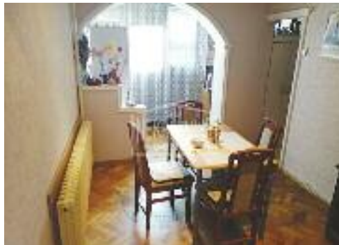
KERTVAROŠ, prodaje se stan u blizini centra i LIDL-a, visoko prizemlje, namešten, centralno grejanje 61 m 2 / 63.000 evra