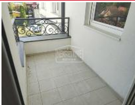
PALIĆ, prodaje se novi apartman, dnevno soba + spravaća soba, kupatilo, terasa, blizu jezera, bazen u zgradi, gas, II sprat, 43,44 m 2 83.000 evra