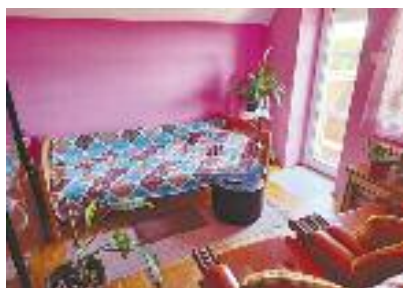
KERTVAROŠ, prodaje se dvosoban stan na petom spratu (nije poslednji), novija zgrada, lift, odmah useljiv, CG, 54 m 2 / 68.000 evra