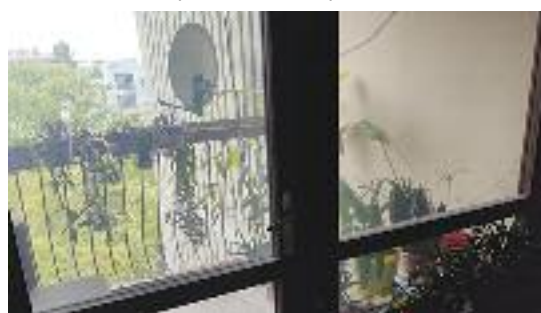
RADIJALAC, prodaje se jednosoban stan sa terasom u zgradi sa liftom, podrumaska ostava, 46 m 2 / 52.500 evra