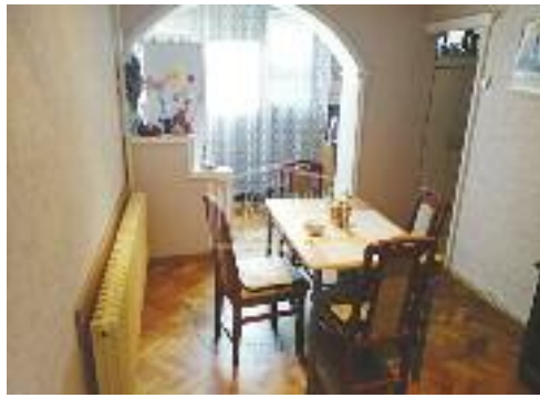
KERTVAROŠ, prodaje se stan u blizini centra i LIDL-a, visoko prizemlje, namešten, centralno grejanje 61 m 2 / 61.500 evra