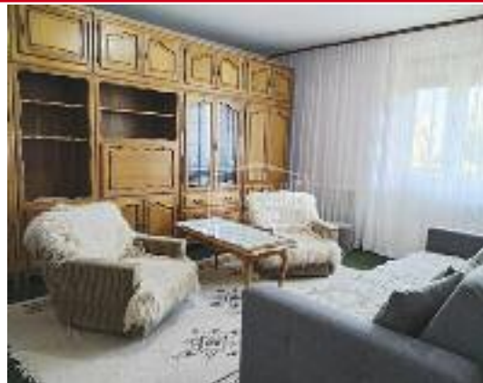
CENTAR III, prodaje se stan u izvornom ali veoma očuvanom stanju, na odličnoj lokaciji u blizini Glavne autobuske stanice, pogodno za izdavanje, 60 m 2 / 52.000 evra