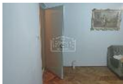
KERTVAROŠ, prodaje se komforan trosoban stan, 2 s + dn. boravak u prizemlju, 70 m 2 / 75.000 evra