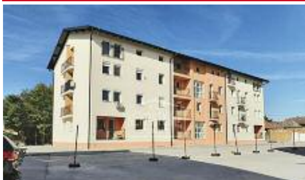
KERTVAROŠ, prodaje se stan (36 m 2 ), na lepom i mirnom mestu u novoj zgradi. Cena: 52.700 evra