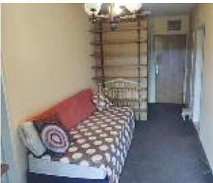
RADIJALAC, prodaje se stan na petom spratu u zgradi sa liftom, za ozbiljnog kupca moguća korekcija cene, 46 m 2 52.500 evra