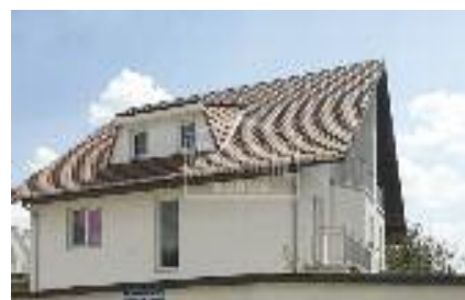
KERTVAROŠ prodaje se odlična kuća, potpuno nova, izgrađena od vrhunskih materijala uvezenih iz Nemačke, a sastoji se iz tri etaže ukupne kvadrature, 203 m 2 / 189.000 evra