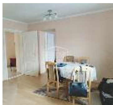
SRPSKI ŠOR, prodaje se renovirana kuća (79 m 2 ) koja se nalazi na placu od 516 m 2 , ali postoji i plac od 1.449 m 2 , koji se može i posebno kupiti (10.900 evra) a sve ukupno 45.000 evra