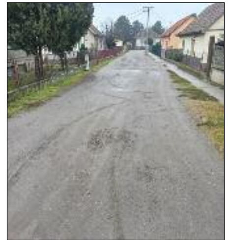
Grebaní asfalt u Kumrovečkoj ulici

„Problemi sa kojima se susreće MZ Peščara pre svega se tiču problema koji se odnose na komunalnu i putnu infrastrukturu. U tom smislu ono što nedostaje građanima ove MZ jeste vodovodna i kanalizaciona mreža, asfaltirane ulice, elektroenergetska mreža, rasveta, gasifikacija i dr. Problemi koji se