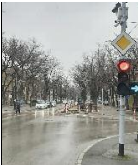
Slike o toku rekonstrukcije raskrsnice Matka Vukovića i Matije Gupca

Kada su planovi u nekoj bližoj budućnosti